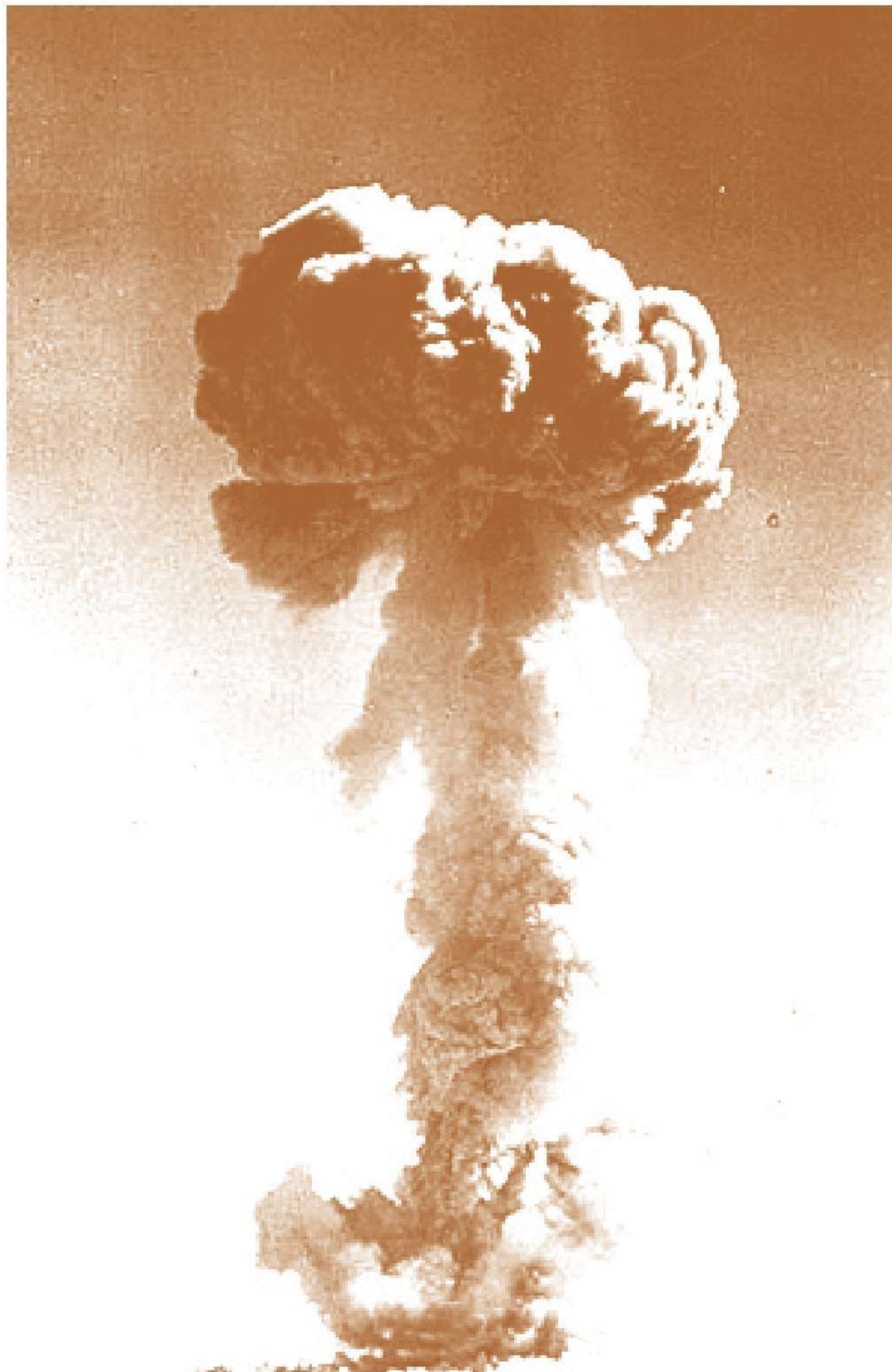
1964年10月16日，我国成功引爆首枚原子弹