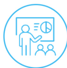
中国文化系列讲座