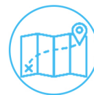
中国文化体验与考察